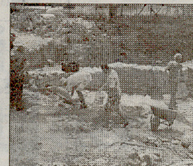
Nga gërmimet në Elbasan

Rinisin gërmimet në mozaikun paleokristian