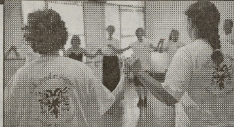
Dje, gjatë orës së mësimi të valleve shqiptare në ambientet e Ansambllit Popullor.